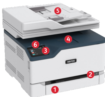
Multifunkční barevná tiskárna Xerox® C235